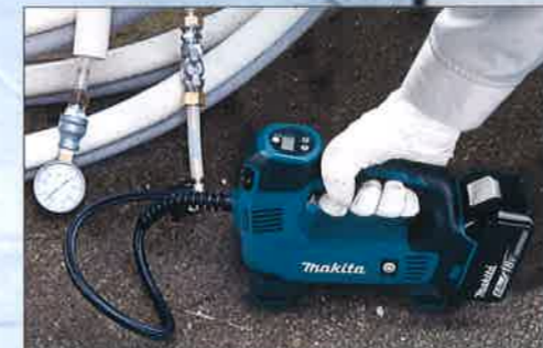
各種設備の点検・確認作業に ※接続には市販品をご利用ください。

吐出量 12 MP180D L/min [200kPa時] 10L/min [MP100D]