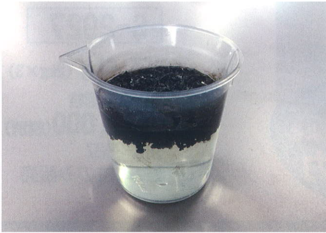
油を吸収しています。