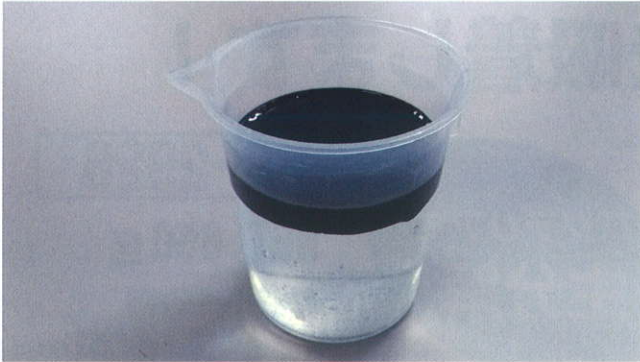
水と重油を入れた容器を用意しました。