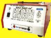
小型、軽作業に最適 スーパーシャイナーUni2 Plus (300W)