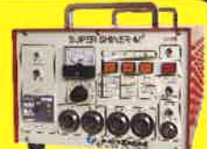
最強パワーの万能型 スーパーシャイナーM 2 (3,000W)