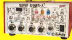
お手頃価格のハイパワー器 スーパーシャイナーA 2 (2,000W)