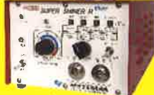
高出力で安価な普及型 スーパーシャイナーR Plus (600W)