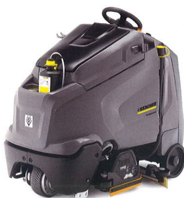
業務用立ち乗り式床洗浄機 「BR 65/95 RS Bp DOSE」 (ローラーブラシ、作業幅 650mm)

倉庫、工場の出荷場や配送センター、空港などの公共施設、大型のショッピングモールなど広範囲の床洗浄に適しています。