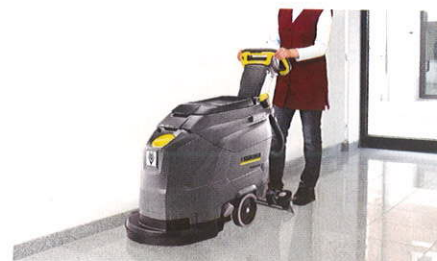
様々な施設の床洗浄に