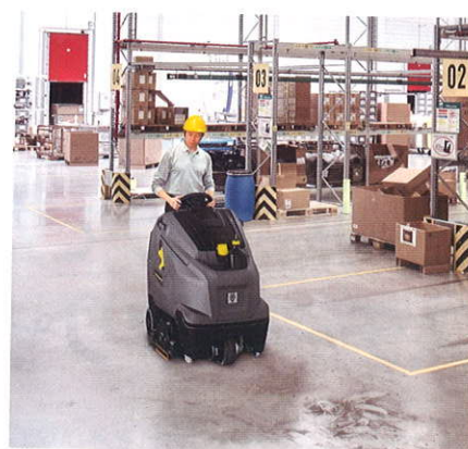
倉庫などの床洗浄に