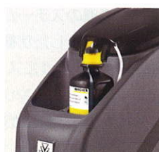
必要なだけ洗浄剤を自動で希釈する洗浄剤節約システム DOSE