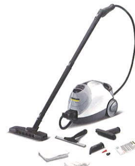
写真はスチームクリーナー SC 4.100 C