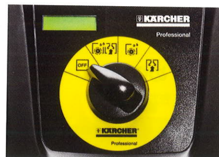
わかりやすい操作パネル