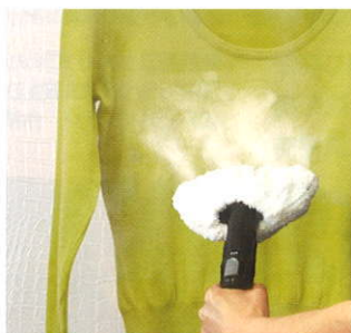
※衣類の絵表示をご確認のうえご使用ください。

約100℃のスチームで汚れを浮かせて落とすスチームクリーナーは、その蒸気で衣服のシワを伸ばすこともできます。ハンドブラシにカバーを取り付け（マイクロファイバー製がおすすめ）、スチームを出しながらアイロンの様に衣類の表面をゆっくりとすべさせます。すると高温のスチームによって繊維のつぶれやゆがみが解消され、ふっくらとした状態にしてくれます。スーツやジャケット（綿・ウール・ポリエステルなど）、ブラウス（綿・シルク・麻など）、コットンパンツ、ジーンズ、ニットといった衣類からカーテンまでご使用いただけます。