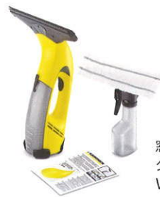
窓用バキューム クリーナー WV 50 Plus