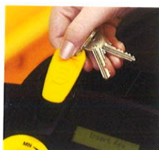
2種類の鍵で作業員と管理者の権限を分ける鍵管理システム KIK