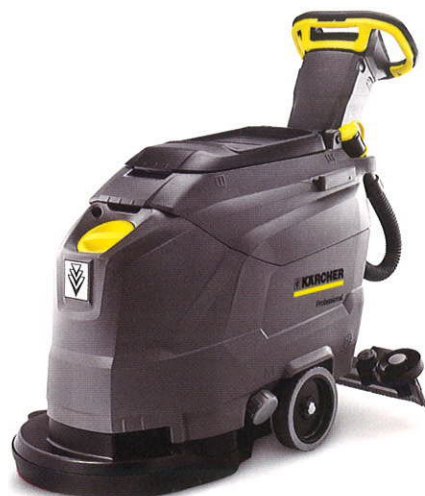
業務用手押し式床洗浄機「BD 43/25 C Bp」